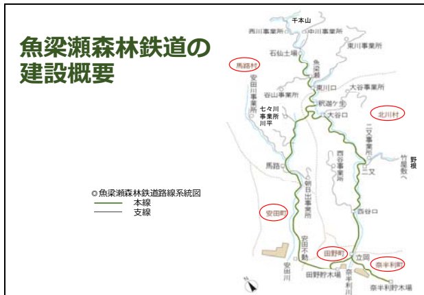
図 3 説明資料の中の1枚

国有林野について、明治6年の官民有区分・地租改正からはじまり、現在までの変遷を多くの写真を用いて詳しく説明された。