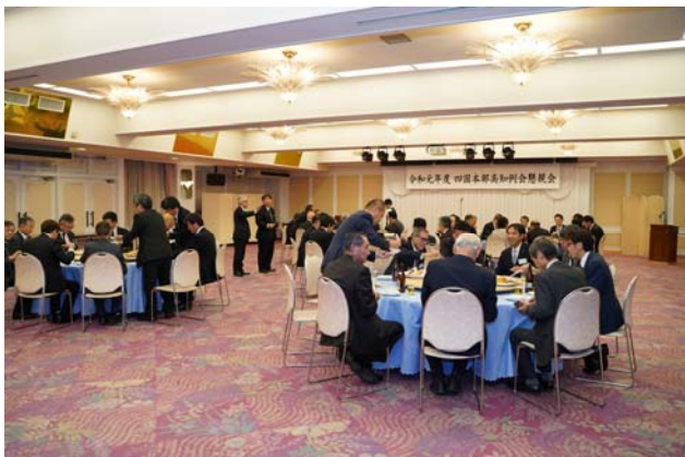
写真 14 懇親会の開催状況

久しぶりに会う方、初めて会う方、様々であるが、たくさく食べ、たくさん飲んで、楽しい時間はあっという間に終わった。