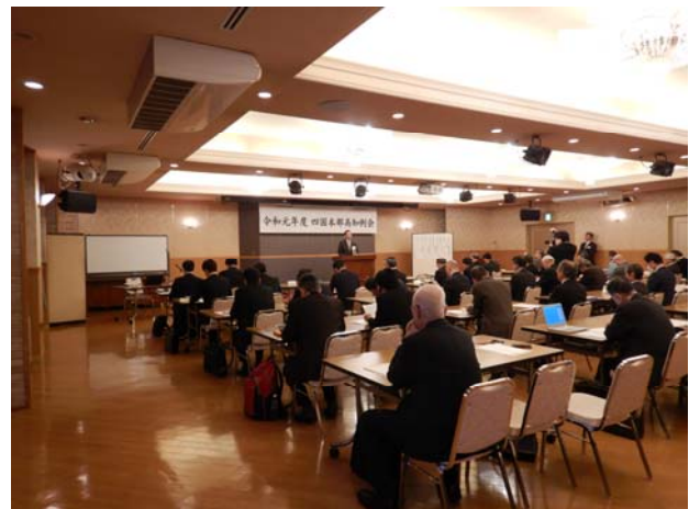
写真 2 会場の様子