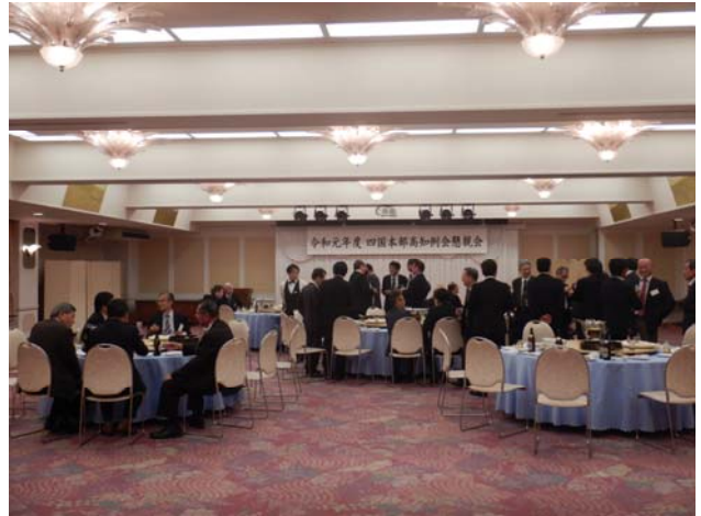
写真 15 懇親会の開催状況