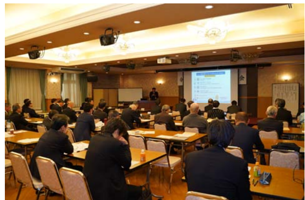
写真 7 荒木氏のセミナー状況